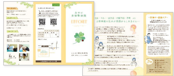
整体院 [リーフレット(巻き三つ折り)]