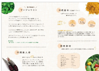
▲P6 - P7