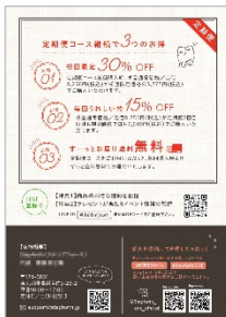
▲表 4 表 1