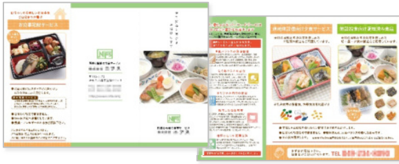
高齢者向けお食事宅配サービス[リーフレット(二つ折り)]