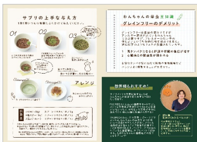
▲P10 - P11