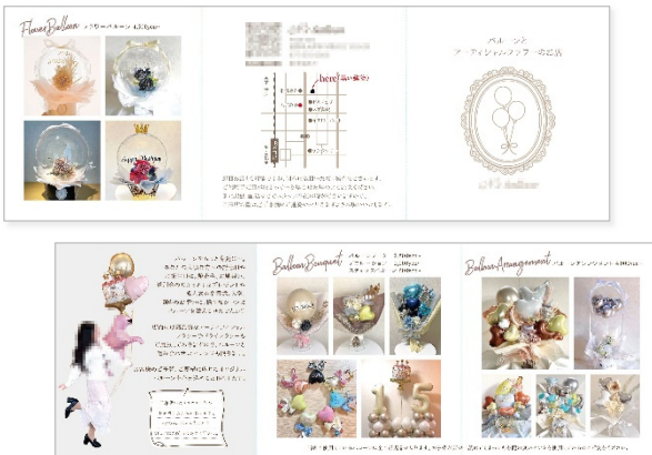
バルーンショップ [リーフレット(巻き三つ折り)]