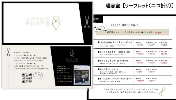
理容室 [リーフレット(二つ折り)]