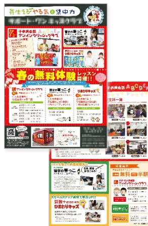
児童向け塾・英会話教室 [チラシ]