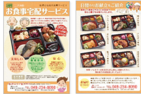
高齢者向け 宅食サービス [チラシ]