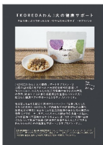
▲P4 - P5