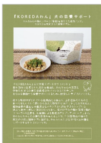
▲P8 - P9